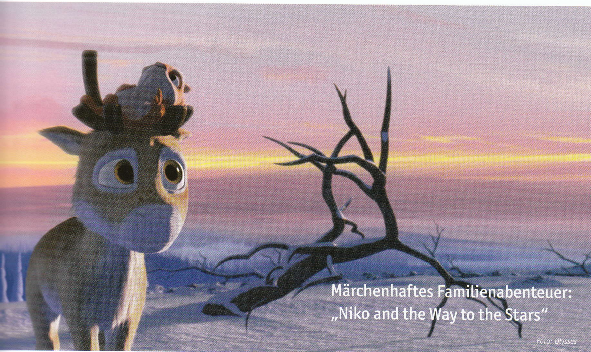
Märchenhaftes Familienabenteuer: „Niko and the Way to the Stars“